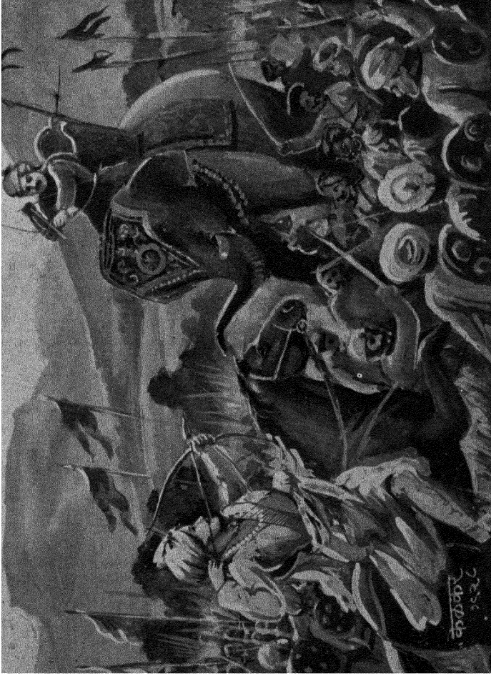
बाजीराव पेशवे व सेनापति दामाडे यांचा धनचोर रणसंग्राम.